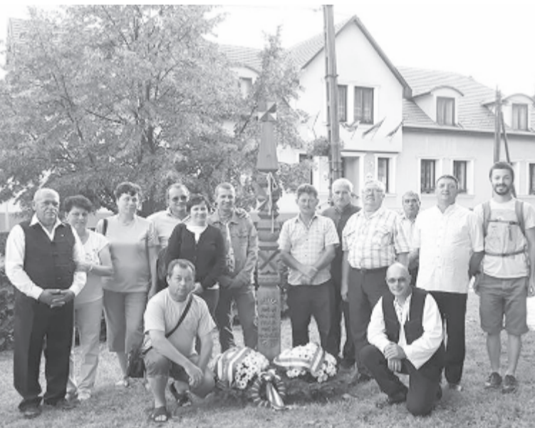
Tizennégy fős küldöttség vitte a kopjafát Csákvárra. Fotó: facebook.com

egy tizennégy fős küldöttség vitte és állította fel a nemzeti ünnep alkalmából az anyaországban.